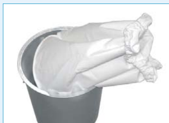
Siebkorb mit Filtersack