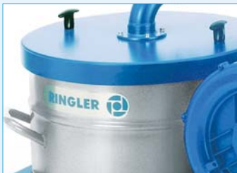
Sammelbehälter Stahl, Volumen 50 Liter