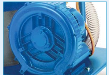
Hochleistungs-Seitenkanalverdichter, nahezu verschleißfrei