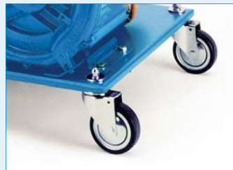
Grundplatte mit Rädern, lenkbar