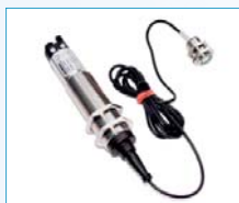
Ultraschall-Distanzsensor zur Füllstandsüberwachung