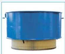
Absolutfilterelement für Feinststäube (Filterklasse „H“)