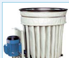
Taschenfilter mit elektrischem Rüttler