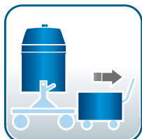
100 Liter Sammelbehälter ausfahrbar