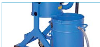
Sammelbehälter 100l ausfahrbar