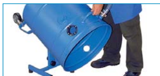
Optional: Kipptleerung mit Gestell als Entleerhilfe