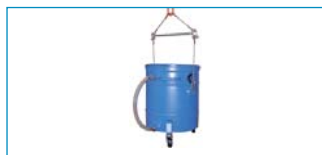
Optional: Krantransport mittels Kranbügel