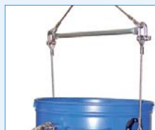
Optional: Entleerung mit Kranbügel