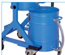
Sammelbehälter 100l ausfahrbar