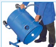
Optional: Kippentleerung mit Gestell