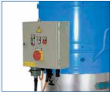
Steuerschrank für Motor, Ventile und Füllstandssensor