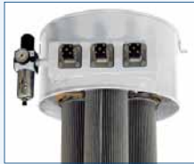
Jetfilterabreinigung im Gegenstromprinzip